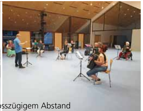
Unsere Proben mit grosszügigem Abstand